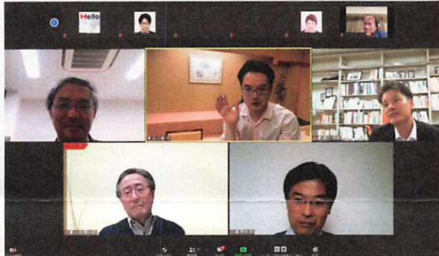
(パネルディスカッション)

第3回目となった2020年度の「医療経済短期集中コース」は、2020年11月20日(金)、21日(土)、22日(日)、28日(土)、29日(日)の日程でオンラインにて行われました。医師・看護師を含む医療従事者、病院事務部門、地方自治体、製薬企業などから、27名の方が第三期生として受講されました。