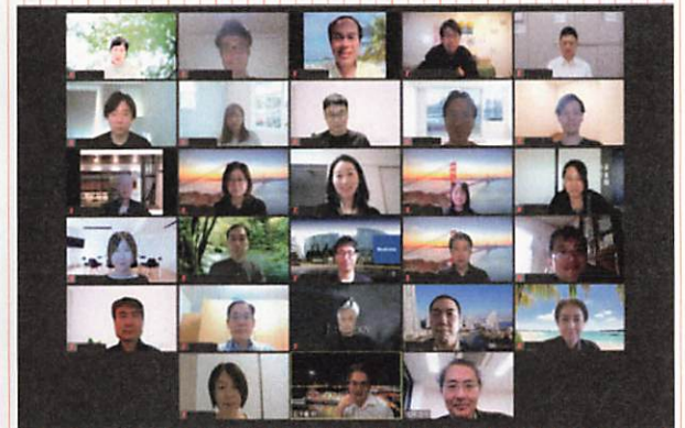
2020年度は、新型コロナウイルス感染症の影響を鑑み、オンライン形式での開催となりました。